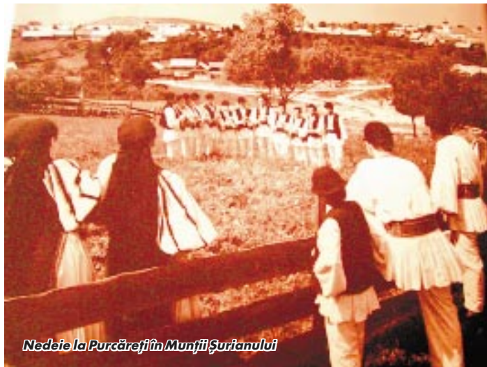
Nedeie la Purcărești în Munții Șurianului

Etnografii numesc aceste sărbători în ansamblul lor „obiceiuri agro-pastorale“. Denumirea - cu iz savant - închide în ea câteva prejudecăți ale cercetătorilor de până acum în acest domeniu. Mai întâi, prejudecata ce rezidă în separarea agriculturii de păstorit, adică acea supoziție mai veche că românii au fost la început numai păstori (sau mai cu seamă păstori) și că au deprins agricultura mai târziu. Or, cercetările mai aprofundate au arătat că oamenii acestor comunități au cultivat pământul și au crescut vite, de când exista poporul român. Deci, cele două ocupații sunt simbolice și, deopotrivă, definesc identitatea etnică românească, caracterizează cultura tradițională în care ruralul intră ca un component important. Ca un comportament important, dar nu unic, deoarece este greu de presupus că poporul român s-a format numai la sate, când știm că