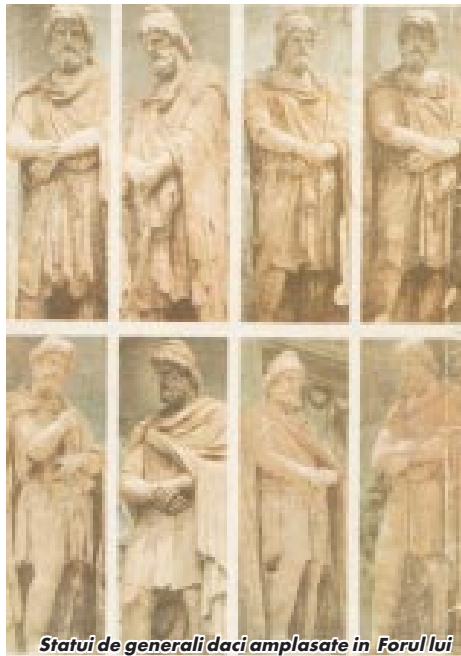
Statui de generali daci amplasate în Forul lui Traian, statui mutate apoi pe Arcul de triumf al lui Constantin cel Mare.