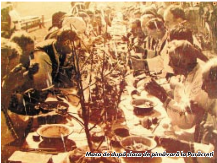
Masa de după claca de primăvară la Purăcreți

Ca un fenomen unic de trecere peste vreme și de mare persistență în fața tuturor